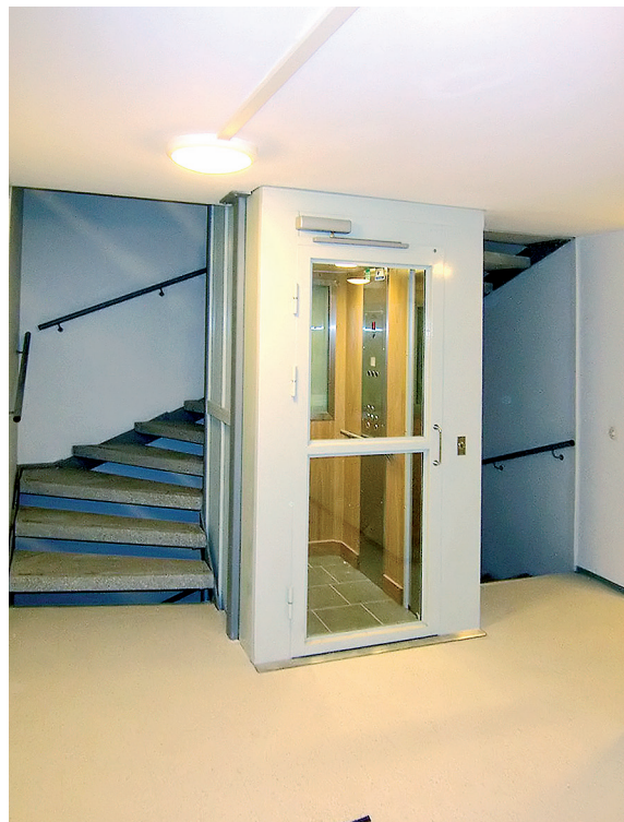
Sisääntulokerros. Uusi jälkiasennushissi.