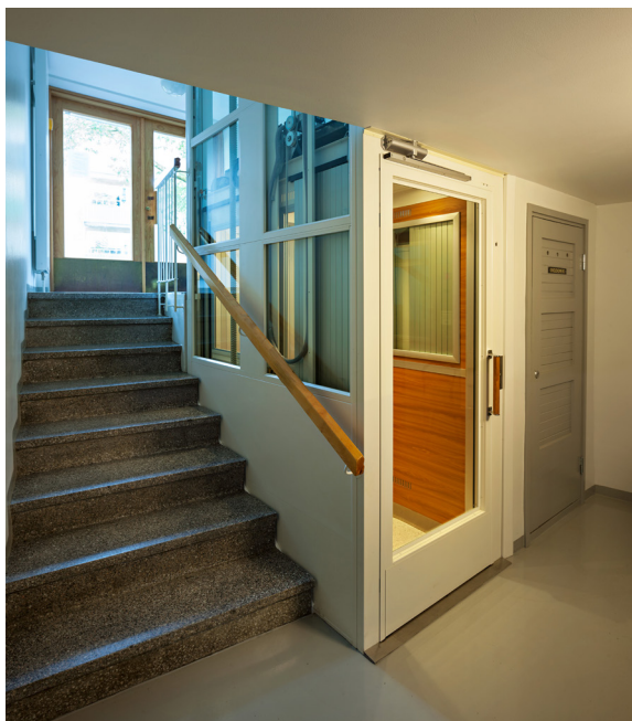
Valoisa porraskäytävä, jossa on läpikuljettava hissi.