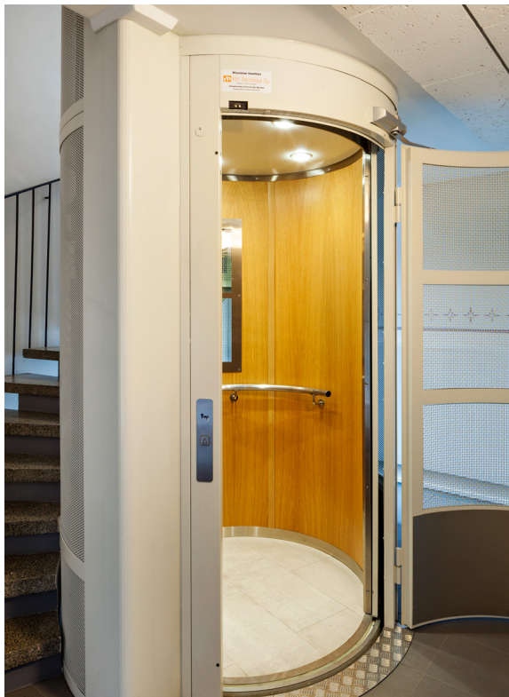
Pyöreä kuilu ja pyöreä hissi.

Hissihankkeen kokonaiskustannukset (2013): 899 582 €, taloyhtiön osuus avustuksien jälkeen 364 567 € (5 hissiä) eli 72 913 € / hissi.