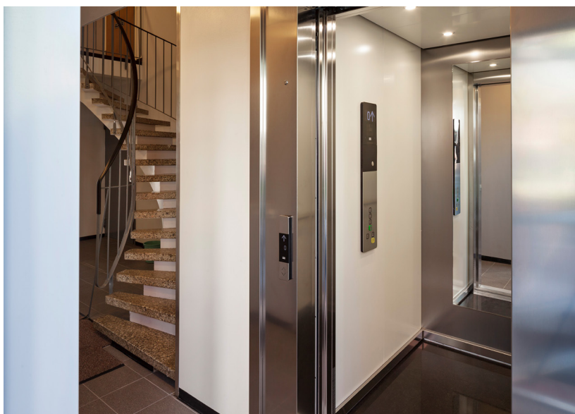
Portaikko ja uusi hissi.