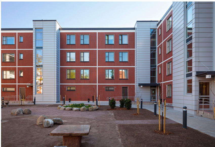
Talon julkisivussa uudet hissitornit.