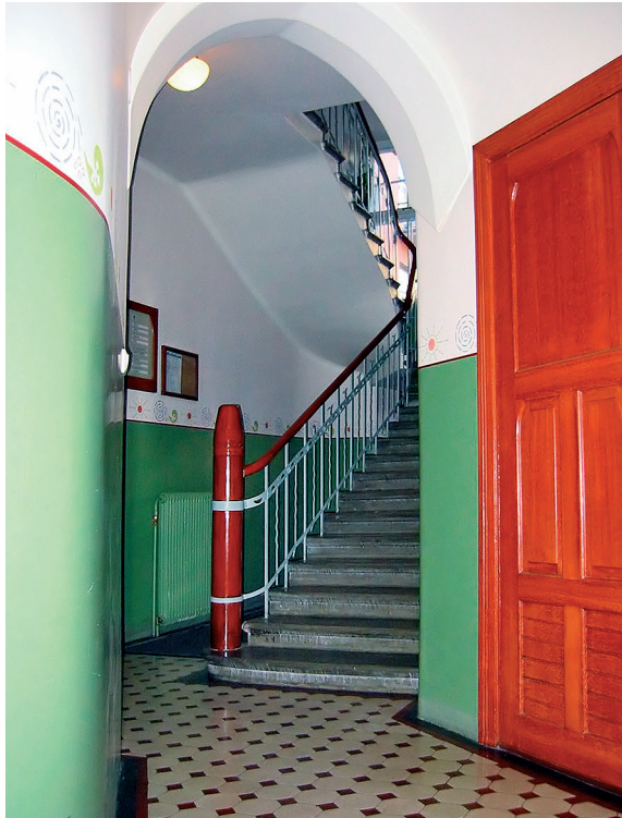
Valokuvat Arkkitehtitoimisto Antti Voutilainen Oy

Hissihankkeen kokonaiskustannukset (2004): 715 171 €, taloyhtiön osuus 357 611 € (5 hissiä).