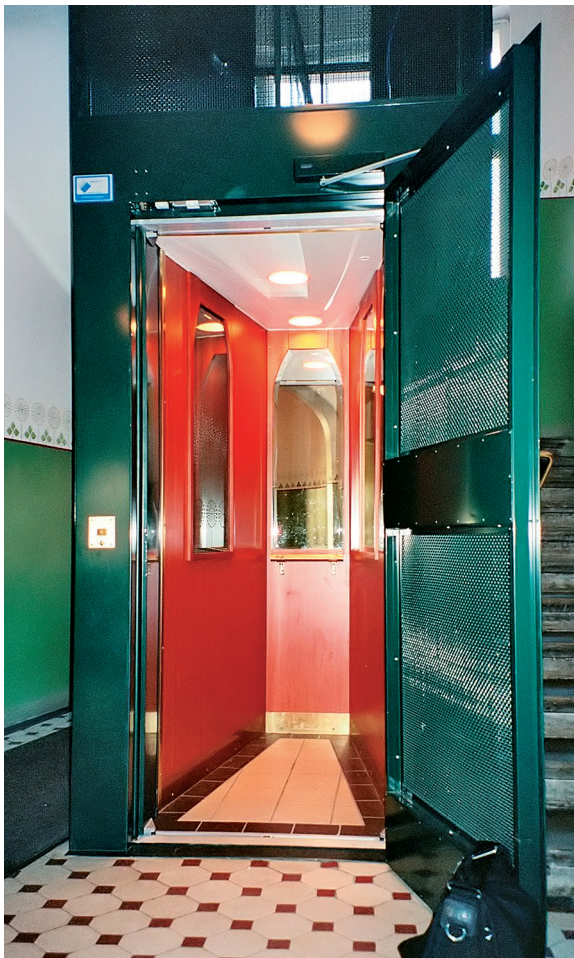
C-porras: kolmiokuilu ja kolmiohissikori.