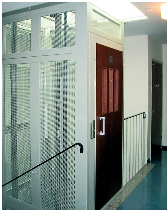
Ylin asuinkerros. Kattoikkuna tuo valoa porrashuoneeseen.