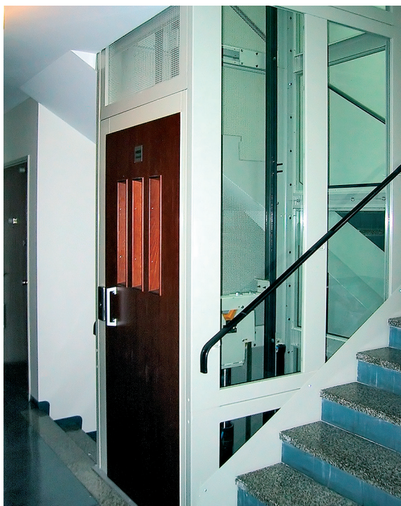
Avara lasikuilu on varustettu potkulistoin.